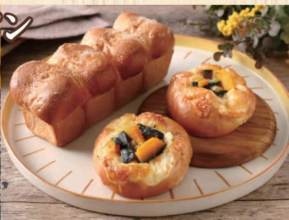
しっとりちみつ食パン/アップルキャラメリゼ