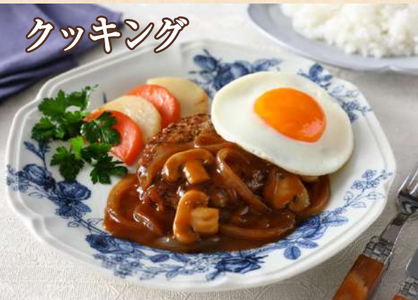
ビーフハンバーグデミグラス風ソース