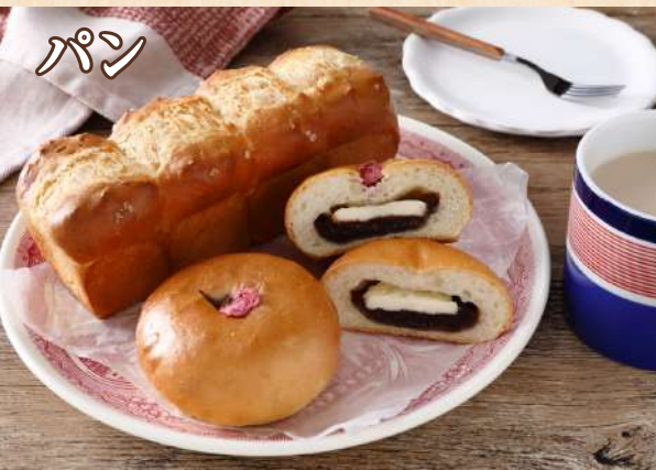
塩バター食パン&クリームチーズあんパン