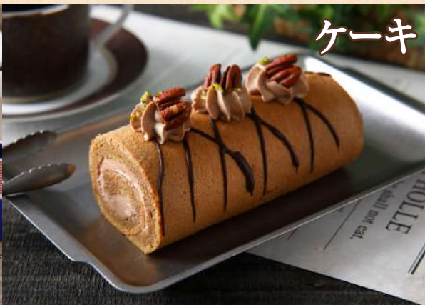
カフェモカシフォンロール